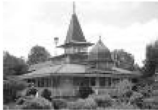
Gambar 6. Masjid Pusaka Banua Lawas.