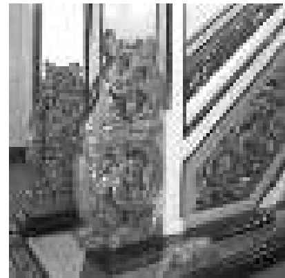
Gambar 17. Panapih mimbar Masjid Agung "AlAnwar" Marabahan.