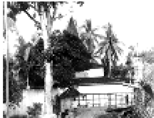
Gambar 8. Masjid Sultan Suriansyah, Kuin.