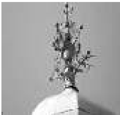
Gambar 15. Pataka bangunan mihrab Masjid Al-Haq, Hantakan.

Sebagai masjid yang arsitekturnya dipengaruhi oleh arsitektur masjid Demak. Sementara Masjid Demak juga mendapat pengaruh dari unsur kepercayaan Jawa pra-Islam, maka atap Masjid Banua Halat, Masjid Pusaka Banua Lawas, dan masjid-masjid lainnya yang beratap tumpang berpuncak lancip adalah bentuk gunung dalam kebudayaan Jawa sebagai simbol dari jagad raya. Puncaknya adalah lambang keagungan dan keesaan. Bentuk simbol ini memang menyerupai gunung (seperti yang sering dipakai dalam wayang kulit). Dalam praktiknya, orang-orang Jawa memasang motif gunung di rumah mereka sebagai pengharapan akan adanya ketenteraman dan lindungan Tuhan dalam rumah tersebut. Terkait dengan masjid, maka puncak masjid berbentuk lancip kemudian dimaknai meng-