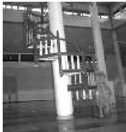
Gambar 12. Tangga lingkaran Masjid Basar Pandulangan Alabio.