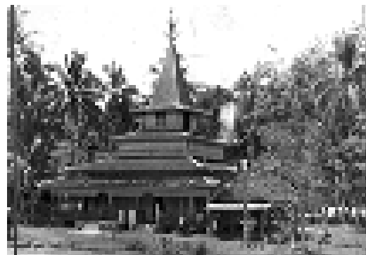
Gambar 10. Masjid Nagara, tahun 1950 an.