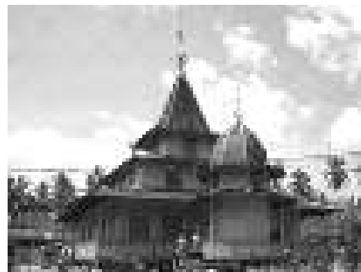
Gambar 2. Masjid Su'ada, Wasah Hilir.