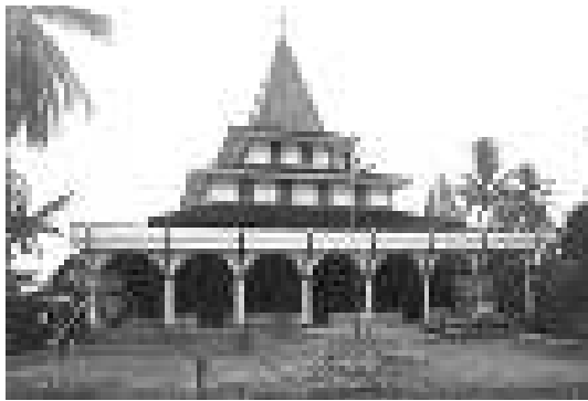
Gambar 5. Masjid Syekh Abdul Hamid Abulung.