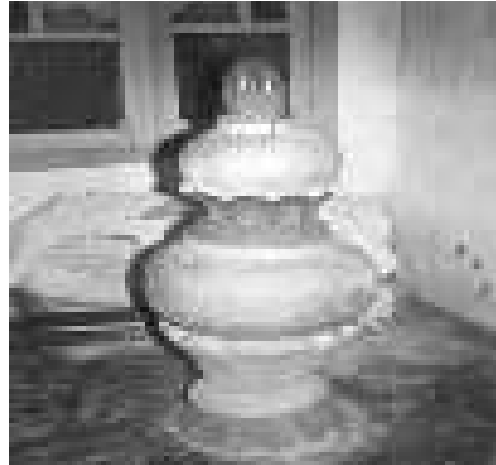
Gambar 14. Bekas pataka Masjid Pusaka Banua Lawas.

masjid. Pataka masjid dari logam tetap seperti sejak awal dibangun. Jika informasi ini benar, maka ada dua kemungkinan. Pertama, pataka tiga beranak itu merupakan sisa bangunan masjid yang ada di lokasi pertama di Teluk Betung. Kemungkinan kedua adalah bahwa ketiga pataka itu adalah pataka sumbangan masyarakat, atau pataka yang tidak jadi dipasang, karena ada pataka lainnya yang terbuat dari logam yang dianggap lebih baik, artistik, dan sesuai penempatannya dengan struktur bangunan atap masjid.