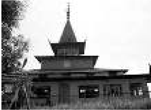
Gambar 3. Masjid Assuhada, Waringin.