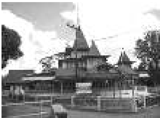
Gambar 1. Masjid Al-Mukarromah, Banua Halat.

Bangunan induk ditopang oleh tiang utama (soko guru) dan tiang samping yang umumnya berpenampang segi delapan. Adakalanya pada