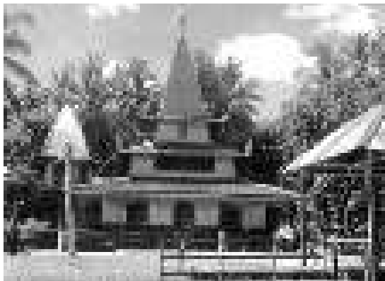
Gambar 7. Masjid Quba, Amawang Kanan.