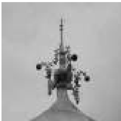
Gambar 16. Pataka Masjid Assyuhada, Sungai Durian.