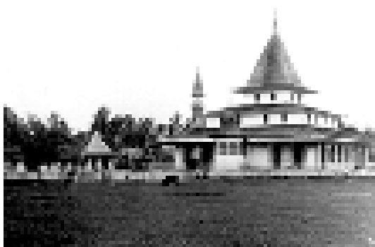
Gambar 9. Masjid Al Karomah, Martapura, tahun 1924.