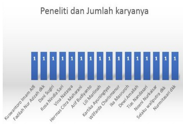
Gambar 1. Peneliti dan Jumlah Karyanya

Studi primer yang telah dipilih selanjutnya diolah berdasarkan peneliti yang baik dan sangat aktif dalam kebijakan pemerintah dalam penyaluran bantuan sosial bagi pelaku UMKM di Indonesia, dapat diidentifikasi pada Gambar 1. Data menunjukkan bahwa peneliti pertama dan lainnya tidak ada yang paling aktif dan juga berpengaruh karena semua peneliti hanya meneliti satu paper jurnal mengenai kebijakan pemerintah terhadap penyaluran bantuan sosial UMKM di Indonesia.